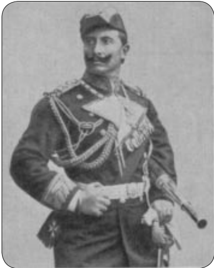
L'Imperatore Guglielmo II in divisa di ammiraglio

L'Imperatore aveva 38 anni quando il 27 marzo 1896 sbarcò ad Ischia. Egli era allora all'apice della sua vigoria, e agli occhi di molti isolani dovette apparire come un condottiero irresistibile; probabilmente non furono pochi quelli che credettero di trovarsi di fronte alla personificazione di un eroe della storia antica. Guglielmo indossava l'uniforme di ammiraglio della marina militare tedesca .