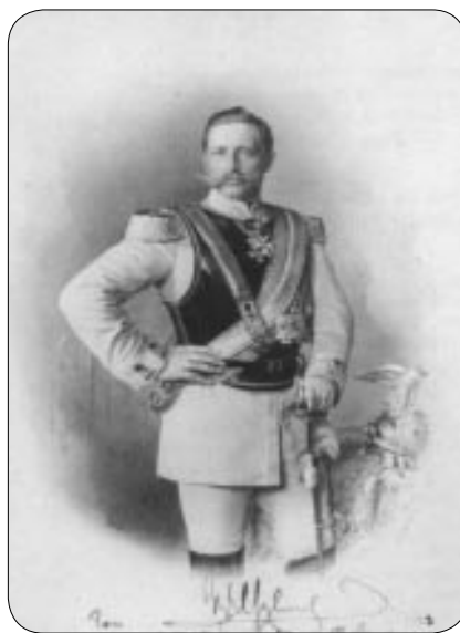
L’Imperatore Guglielmo in un acquerello di E. Bieber

L’Imperatore aveva 38 anni quando il 27 marzo 1896 sbarcò ad Ischia. Egli era allora all’apice della sua vigoria, e agli occhi di molti isolani dovette apparire come un condottiero irresistibile; probabilmente non furono pochi quelli che credettero di trovarsi di fronte alla personificazione di un eroe della storia antica. Guglielmo indossava la divisa della quale era più orgoglioso - e che maggiormente faceva risaltare il suo fascino: l’uniforme di ammiraglio della marina militare tedesca, e gli immancabili guanti bianchi, provvidenziali per mascherare la lieve anomalia al braccio sinistro.