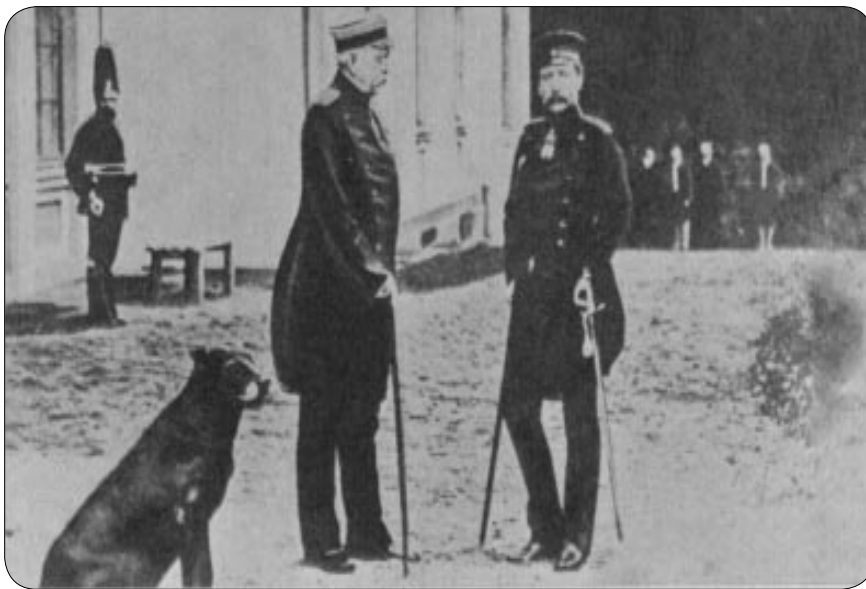
L'Imperatore Guglielmo II con il Cancelliere Bismarck