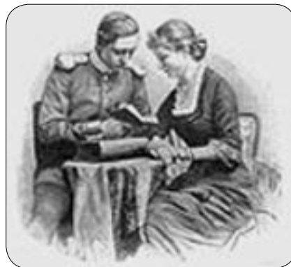
L'Imperatore e l'Imperatrice

«Ma anche colà le vetture non rimasero che ben poco, perché una nuova disposizione le fece correre a Casamicciola, dove gl'Imperiali si sarebbero recati nelle imbarcazioni a vapore del loro yacht». L'esplorazione continua affermando che «L'arrivo di queste vetture mise in movimento gli abitanti di quel paese, i quali accorsero alla marina per