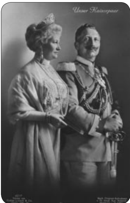
L'Imperatore Guglielmo II e Auguste Viktoria