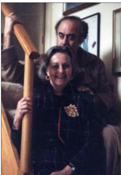
Sciù-Sciù e Victor in biblioteca