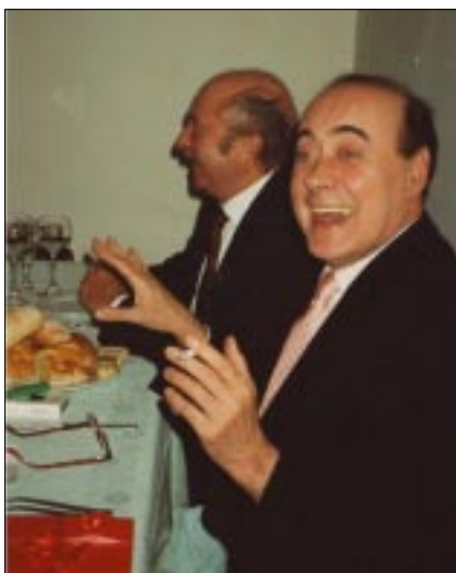
Victor, allegria a tavola