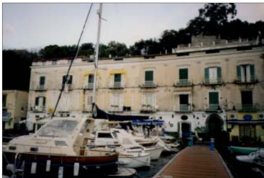
Palazzo Lucibello sulla riva destra del porto, sede del Comando inglese

Sulla riva destra fu requisito il palazzo "Lucibello" dove negli appartamenti del secondo piano furono sistemati sei o sette uffici, al primo