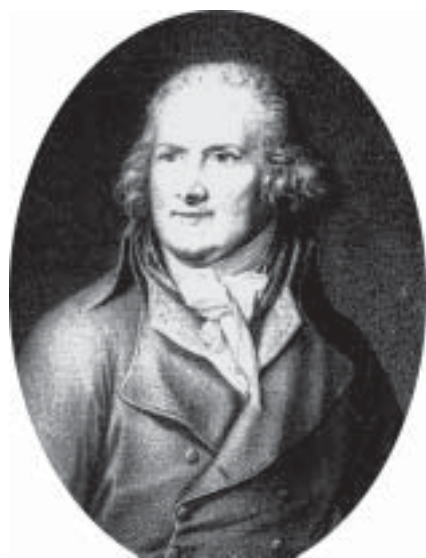
In alto: Jacob Philipp Hackert, di August Nicodemo (1796). Penna e pennello marrone cm 24,4 x 20,4. Düsseldorf, Goethe Museum.