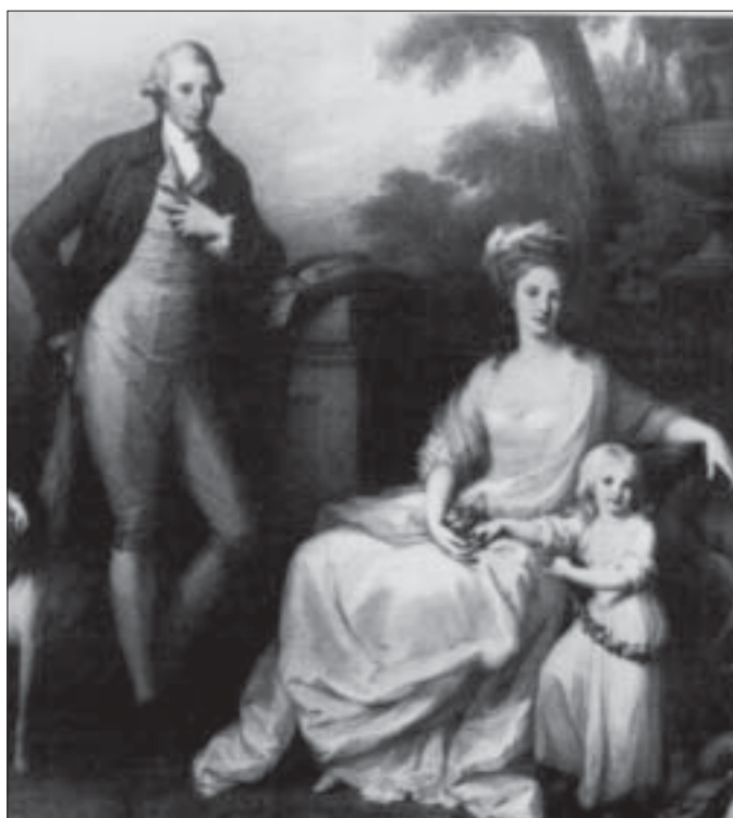
Ferdinando IV (re di Napoli) - III - (re di Sicilia) - I (re delle Due Sicilie) con Maria Carolina (particolare di un dipinto di Angelica Kauffmann)