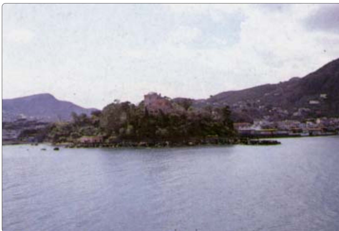
Il porto d'Ischia visto dal mare

Potenziamento stazione marittima (palazzo D' Ambra) Potenziamento servizi alla nautica da diporto (ex terme Comunali) Terminal Bus e Piazzale Trieste Parcheggi: Strada Statale e Jolly Hotel presenta particolari difficoltà e non incide in maniera apprezzabile sulle autorizzazioni già rilasciate.