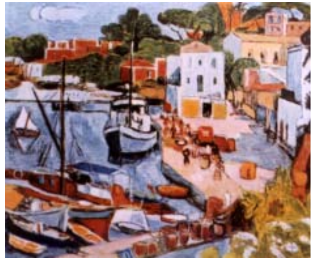
Purrmann - La Riva destra del porto d'Ischia