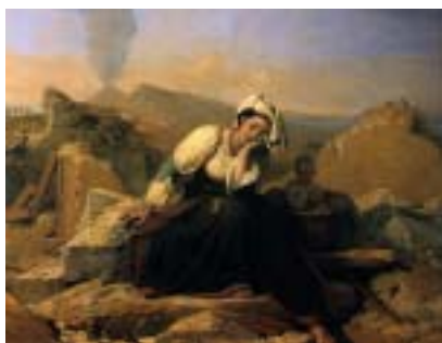
L. Robert - Donna d'Ischia piange sulla casa distrutta dal terremoto, 1828-30

disastroso terremoto, che colpì Casamicciola il 2 febbraio 1828, e raffigura una giovane donna nel tipico costume ischitano, mentre piange sconsolata con accanto un bambino in una cesta. Nonostante il soggetto drammatico, Robert se ne fa interprete senza rinunciare alla sua indole poetica e senza scivolare nella cronaca raccapricciante.