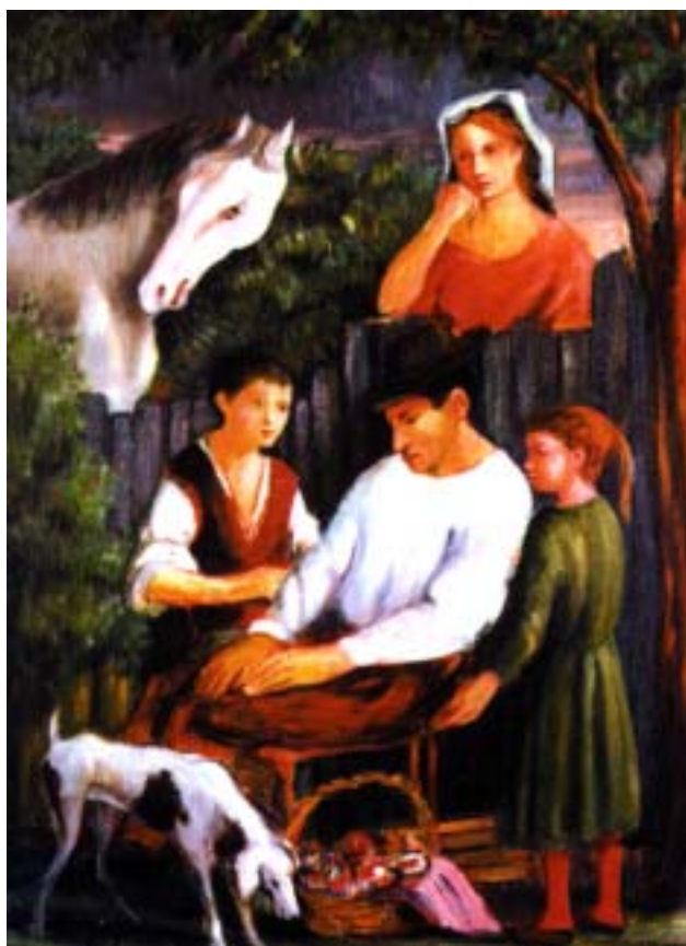
Foto - D. Purificato: Famiglia contadina (1981), olio su tavola, cm 70x50

Sembra quasi che l'amico De Libero sia ispirato per i suoi versi poetici dal mondo pittorico di Purificato e