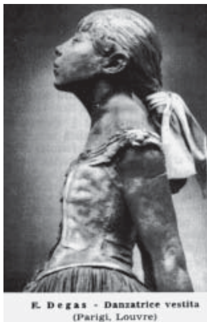
E. Degas - Danzatrice vestita (Parigi, Louvre)

fessione con la fondazione della Banca De Gas), il giovane Edgar rimase nella capitale francese con il