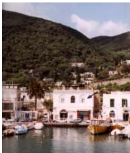
Ischia Porto - Casa Macri

I colori e il cromatismo che riflettono queste due tele sono affascinanti; vi si legge lo stupore dell'artista nello scoprire la luce mediterranea che contrasta fortemente con i cieli sporchi e malinconici di molti paesi nordici. Il tratto sembra fugace; uno schizzo veloce, essenziale, riempito di colore, senza troppe ombreggiature: quasi un innocente, ingenuo paesaggio matisiano, ridondante e festoso di colori vivissimi, caldi, fiabeschi, come d'altra parte è contrassegnato il Fauvismo. Ma nella pittura di Purrmann confluisce anche un cauto espressionismo che sembra anticipare, ma di pochi anni, le esperienze ischitane di Gilles a S. Angelo e di Bargheer a Forio.