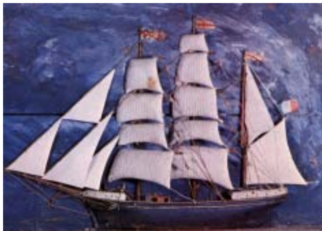
Lacco Ameno, Chiesa di S. Restituta: ex voto con veliero (ignoto del sec. XIX)

piccole imbarcazioni naviganti senza regolari patenti, come era il caso delle tartanelle di Ischia e di Procida» 75 . La Giunta di Commercio nel 1714 aveva suggerito alla R. Corte di costruire navi mercantili da vendere a buon prezzo ai privati proprio per favorire la costruzione di imbarcazioni private. Questa politica riuscì ad assicurare, attraverso la protezione delle navi mercantili ed una serie di trattati politici e mercantili, anche un periodo abbastanza lungo di tranquillità e sicurezza alle coste meridionali, liberandole dai pericoli di attacchi da parte di pirati e corsari. Si sviluppò così ulteriormente quel movimento continuo di vascelli, brigantini, feluche che affollava il molo di Napoli e «buona parte del golfo fino a Ischia e Procida» 76 . Ischitani e Procidani poi godevano anche dell'esenzione dal pagamento dello «jus falangagij». Esso consisteva nel pagamento di una tassa, che poteva oscillare da poche grana fino a centosessanta, a seconda dell'imbarcazione, della provenienza e del carico, per ogni «imbarcazione che entrava nel porto di Napoli carica di frutti, fiori ed erbe di qualsiasi genere provenienti dal Regno» 77 .