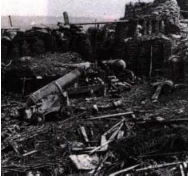
La fortezza di Sebastopoli conquistata dalle truppe europee alleate

La diretta conseguenza di questa vittoria fu la resa di Sebastopoli, alla cui capitolazione furono presenti anche molte unità dell'esercito piemontese. Circa la battaglia della Cernaia , va detto che, pur essendo uno scontro di modesto livello nel panorama dei grandi combattimenti che si ebbero nel corso dell'800, è considerata un avvenimento di notevole rilievo all'interno della nostra storiografia militare nazionale. Ciò, non solo perché i soldati dell'armata sarda combatterono con disciplina e valore, ma anche in quanto segnò l'ingresso dell'esercito piemontese fra quelli europei più accreditati e significativi. Peraltro con questo intervento iniziava anche la partecipazione dei soldati italiani fuori della nostra penisola in veste di protagonisti. Evento destinato a perpetuarsi sino alle attuali missioni di pace in ogni angolo della terra.