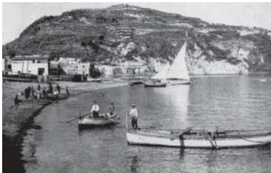
Antica veduta di Lacco Ameno- Spiaggia e pescatori

In un'altra improvvisa impennata della barca a causa di un'onda particolarmente violenta si schiantò l'albero che fu buttato a mare insieme all'antenna, alla quale erano ancora