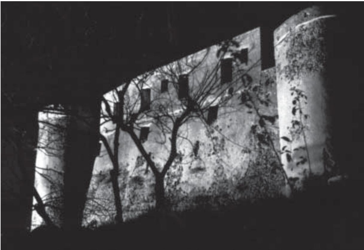
Ischia - Castello Aragonese: il Maschio, già dimora di principi, re e regine