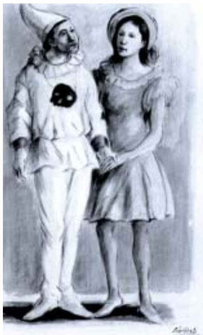
D. Purificato: Pulcinella e Colombina , tecnica mista su carta, cm 50x35

Anche in questa occasione Purificato manterrà quell'equilibrio, quella sua metodica e quel suo linguaggio naturale, senza abbandonarsi, come avevano fatto altri, ad improvvisi bagliori e ad un estro momentaneo o al gioco del capriccio, rischiando di apparire ad alcuni un «provinciale». Piangerà dalla gioia Purificato, di fronte all'entusiasmo ed alle manifestazioni genuine dei contradaioi vittoriosi, che lo porte-