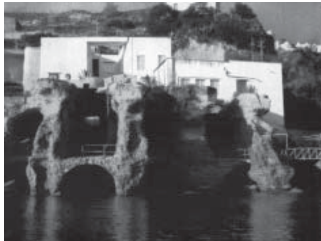
Ruderi di una villa romana a Baia

La riconsacrazione dei luoghi violentati dalla guerra fu quasi un atto di espiazione sacra; e ventura volle che quella riconsacrazione, più che da aruspici e pontefici, fosse fatta da un grande poeta, da Virgilio. Viveva in quegli anni Virgilio a Napoli; aveva composto il poema della terra, le Georgiche , ispirandosi ai campi, alle coltivazioni, agli animali, al costume della terra campana e si accingeva al più alto canto dell'epopea romana, all' Eneide . E un giorno dall'acropoli di Cuma, innanzi al lido selvoso e accanto alla bocca dello speco oracolare, vide il poeta l'arrivo delle navi di Enea, lo sbarco dei compagni di esilio, la caccia e la preda delle belve nella cupa foresta del litorale per allestire le mense, l'ascesa dell'eroe all'Acropoli con il fido Acate e la sosta innanzi ai fastigi e alle porte istoriate del tempio, l'incontro e il responso della Sibilla, mentre spuntava lontana la