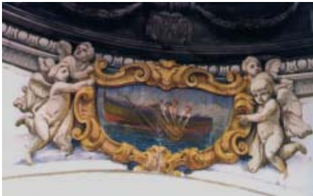
Ischia, Chiesa dello Spirito Santo: barca di pesca con la sciabica, particolare della volta (ignoto stuccatore del sec. XVIII)

«Vienna cercò di stimolare la costruzione di naviglio mercantile, offrendo incoraggiamenti negli approvvigionamenti di legname e chiudendo un occhio sulle