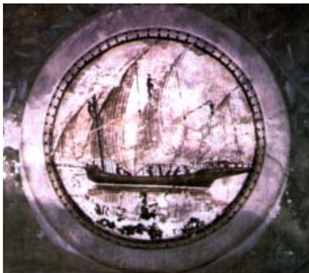
Ischia, Chiesa dello Spirito Santo: volta della sacrestia, particolare (ignoto stuccatore del sec. XIX)