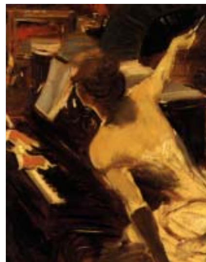
Boldini - La cantante mondana, 1884