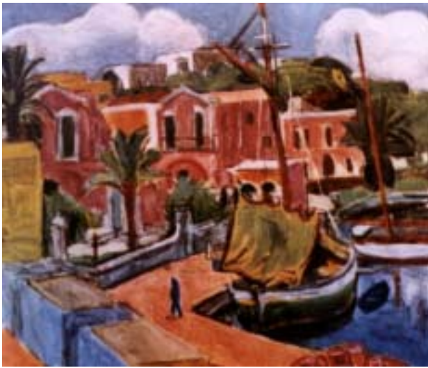
Purrmann - La Riva sinistra del porto d'Ischia