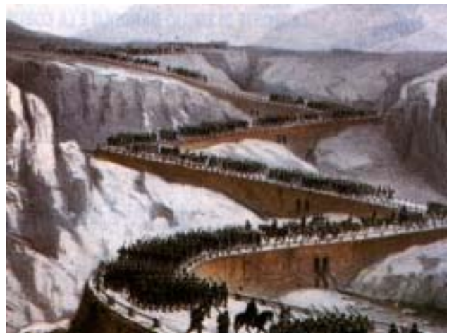
L'arrivo dei francesi attraverso il passo del Moncenisio

Accortosi, anche se con forte ritardo, della manovra avvolgente dei francesi, Giulay riuscì ugualmente a concentrare un forte quantitativo di truppe a difesa di Milano. Pertanto quando il 4 giugno nei pressi di Magenta giunsero le avanguardie dell'armata francese, unitamente ad alcuni reparti piemontesi, trovarono la strada sbarrata da una forte concentrazione di nemici. Inizialmente e per diverse ore l'avanzata venne fermata dall'elevato numero di austriaci. In serata l'arrivo sul campo di battaglia di un nuovo Corpo d'armata al comando di Mac Mahon, che già era stato impegnato in precedenza nei dintorni, seguito a breve distanza da una divisione piemontese, fece volgere l'andamento dello scontro a favore degli alleati. Il successo ottenuto non venne sfruttato sino in fondo. Non fu colta, infatti, l'occasione per infliggere agli asburgici una ben più grave e decisiva sconfitta. Pertanto al Giulay fu così possibile riuscire a far ripiegare in ordine i suoi