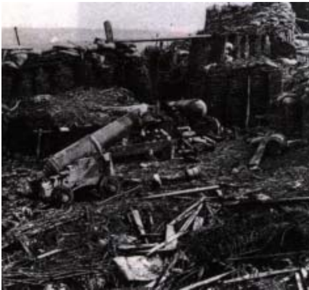
La fortezza di Sebastopoli conquistata dalle truppe europee alleate

La diretta conseguenza di questa vittoria fu la resa di Sebastopoli, alla cui capitolazione furono presenti anche molte unità dell'esercito piemontese. Circa la battaglia della Cernaia , va detto che, pur essendo uno scontro di modesto livello nel panorama dei grandi combattimenti che si ebbero nel corso dell'800, è considerata un avvenimento di notevole rilievo all'interno della nostra storiografia militare nazionale. Ciò, non solo perché i soldati dell'armata sarda combatterono con disciplina e valore, ma anche in quanto segnò l'ingresso dell'esercito piemontese fra quelli europei più accreditati e significativi. Peraltro con questo intervento iniziava anche la partecipazione dei soldati italiani fuori della nostra penisola in veste di protagonisti. Evento destinato a perpetuarsi sino alle attuali missioni di pace in ogni angolo della terra.