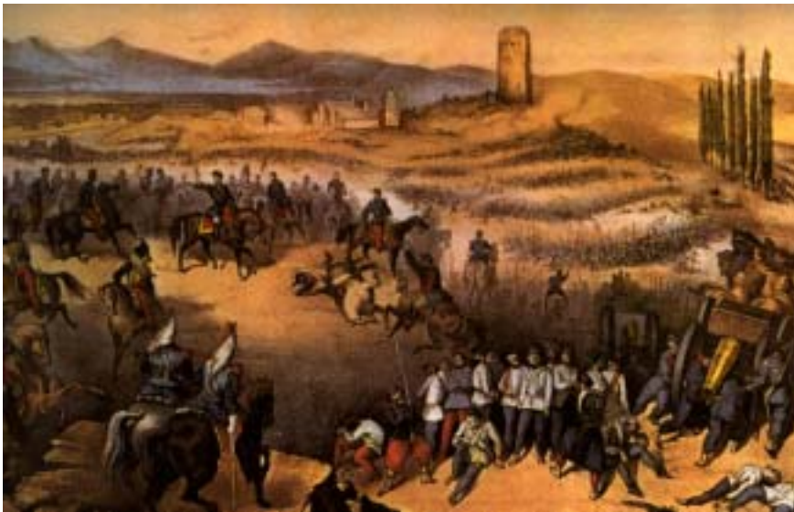
La battaglia di Solferino

scompigliati reparti sino al raggiungimento di territori dichiaratamente sicuri. Quale diretta e immediata conseguenza di questo scontro si ebbe che l'8 giugno Napoleone III e Vittorio Emanuele II fecero il loro trionfale ingresso a Milano. In questo stesso giorno a Melegnano alcuni Corpi d'armata dell'esercito francese attaccarono con decisione una brigata austriaca di retroguardia, posta a difesa di un ponte sul fiume Lambro. Ancora una volta la vittoria arrise alle truppe di Parigi che costrinsero la brigata avversaria a ripiegare rapidamente. Dopo aver seguito con trepidazione ed ansia il cattivo andamento delle operazioni militari del proprio esercito, il 16 giugno l'imperatore d'Austria Francesco Giuseppe esonerava il maresciallo Giulay dal suo incarico e assumeva di persona il comando dello scacchiere, coadiuvato dal generale von Hess quale capo di Stato Maggiore.