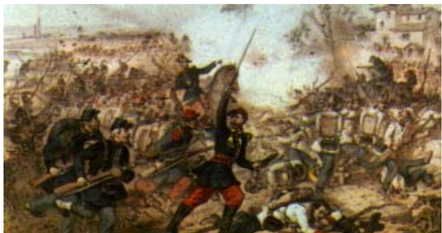
La battaglia di Montebello

Il primo scontro tra gli opposti schieramenti si ebbe