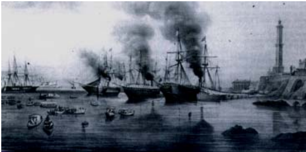
Le truppe del Corpo di spedizione in Crimea s'imbarcano a Genova

Traghetati da navi britanniche, i reparti sardi, al comando di Alfonso La Marmora, appena sbarcati e ancora prima di venire a contatto con le unità zariste, dovettero subito confrontarsi con un nemico ben più terribile: il colera. Triste piaga che accompagnerà l'esercito sabaudo per tutta la durata della sua permanenza fuori dai confini e provocherà la morte di ben 1300 uomini, fra cui Alessandro La Marmora, fondatore del corpo dei Bersaglieri.