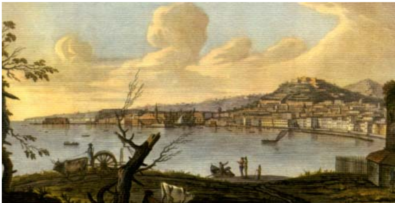
Veduta di Napoli (incisione da W. Hamilton, Campi Flegrei, 1776)