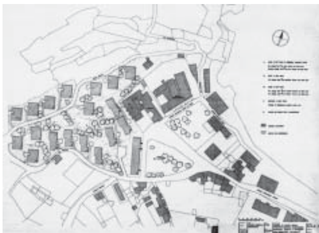
Quartiere Genala. Planimetria generale soluzione I, scala 1:200, tav. R/LA3, 5 febbraio 1953