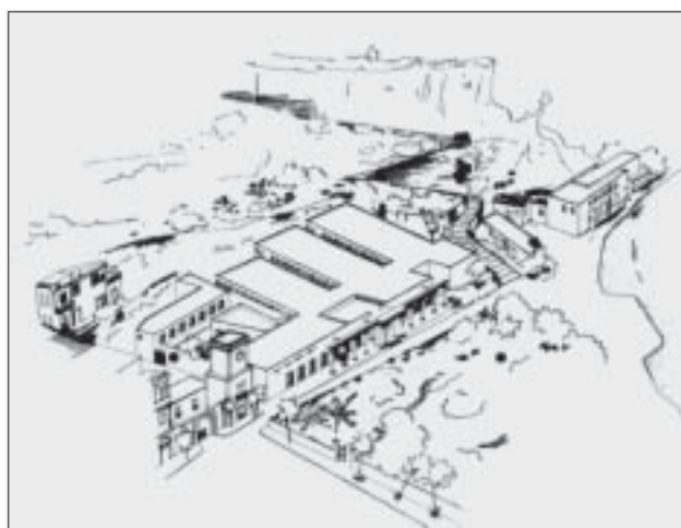
Terme Regina Isabella. Prospettiva a volo di uccello, con l'ampliamento delle Terme verso via Montevico.