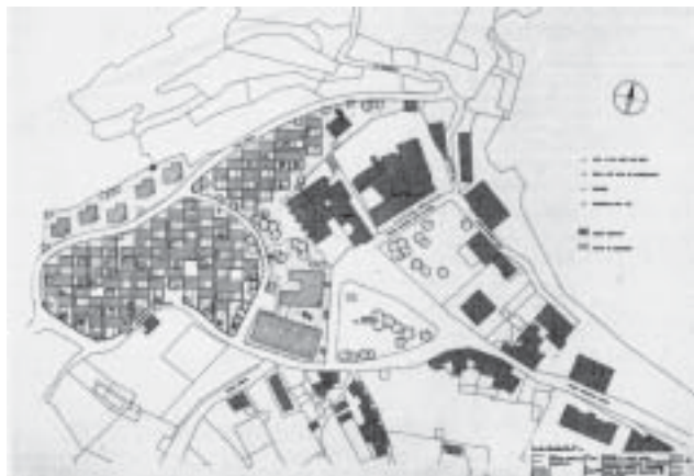
Quartiere Genala. Planimetria generale soluzione II, scala 1:200, tav. R/LA5, 5 febbraio 1953

del Municipio e una nuova zona residenziale in un'area verso Casamonte, di fronte alla Pietra del Lacco. Agli interventi di espansione e ricomposizione urbana si aggiungono importanti previsioni infrastrutturali, come la realizzazione di una nuova strada che completa lo sviluppo anulare della viabilità locale e lo studio esecutivo dei percorsi della rete di fognatura e degli scarichi a mare.