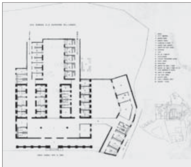
Terme Regina Isabella. Planimetria del primo progetto, scala 1:100. Tav. PTH1, 29 aprile 1950