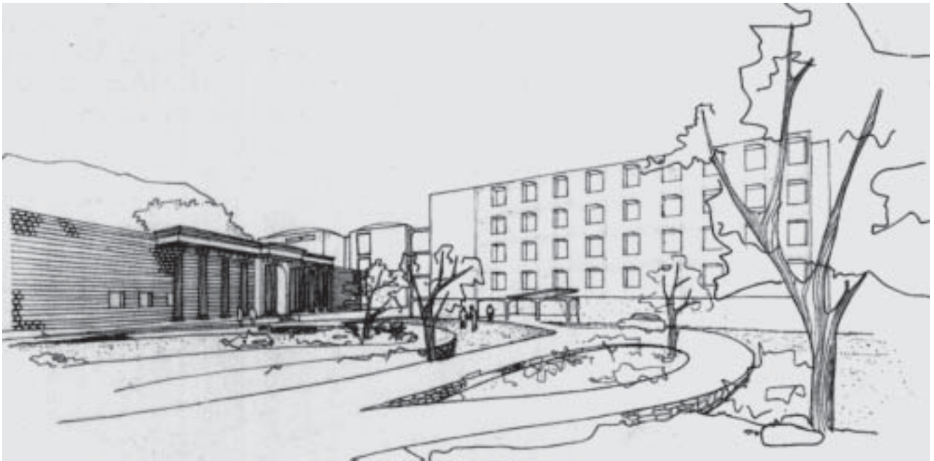
Terme Regina Isabella. Vista prospettica della piazza del Municipio verso le terme. Tav. PTH37, 24 settembre 1950.