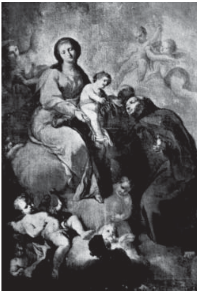
S. Giovan Giuseppe riceve il S. Bambino da Maria SS.ma