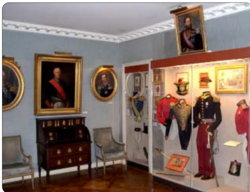
Museo degli Svizzeri nel Mondo Castello di Penthes, Pregny Ginevra; sala 16 D, (von Schwarzenbach).