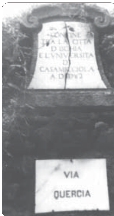
Indicazione di confine tra Villa dei Bagni (Ischia) e Casamicciola