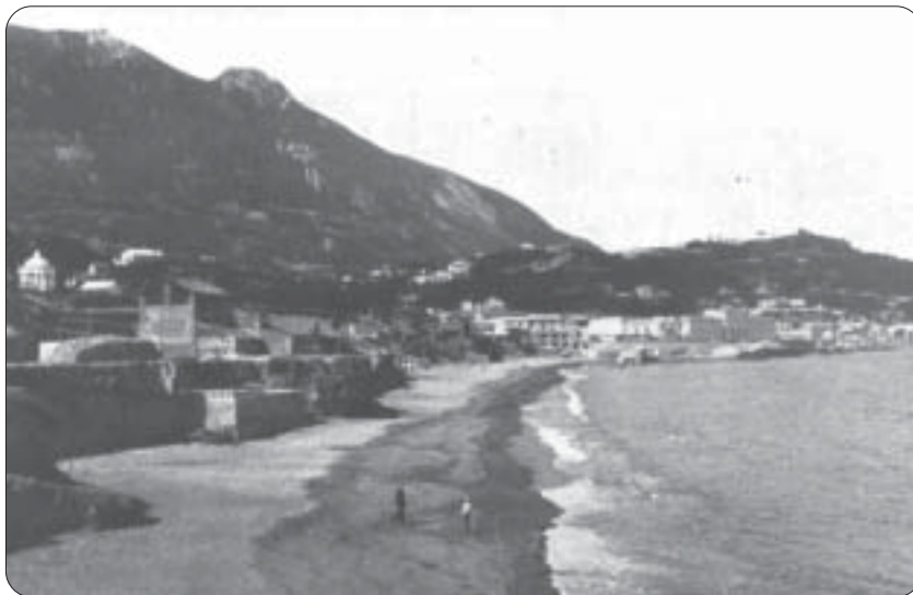
Da questa rara foto della Collezione Alinari si rileva sul lungomare la presenza di numerose fabbriche di terracotta testimonianti l'antica tradizione dei vasai di Casamicciola