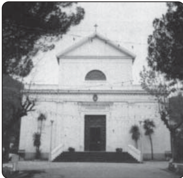
Facciata esterna della Parrocchia del Sacro Cuore e di Santa Maria Maddalena elevata a dignità di Basilica Pontificia

aperta al culto nel 1885 con il titolo di Chiesa di Maria SS.ma Immacolata. Nei pressi la Chiesetta di Santa Maria dei Suffragi detta del Purgatorio, la cui probabile data di fondazione sembra essere il 1695; fu ricostruita nel 1890 e nel 1949, ed ancora rifatta negli ultimi anni dopo un incendio. Vi si venera l'Addolorata (in La Diocesi d'Ischia e le sue chiese di G. Castagna e A. Di Lustro, luglio 2000).