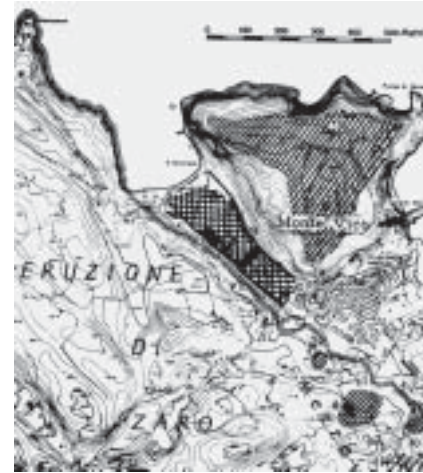
Rilievo generale dell'insediamento di Pitecusa: Tratteggio - Aree abitate documentate da avanzi di ceramica (Monte di Vico e nuclei minori sulla collina di Mezzavia) Tratteggio incrociato - Necropoli (San Montano) Nero pieno - Zone degli scavi (in Pier Giovanni Guzzo - Le città scomparse della Magna Grecia , Newton Compton Editori, 1982 pag. 176).

Sorge spontanea la domanda se i primi Greci che approdarono a Pitecusa non abbiano occupato anche il resto dell'arcipelago, vale a dire l'odierna Procida e l'o-