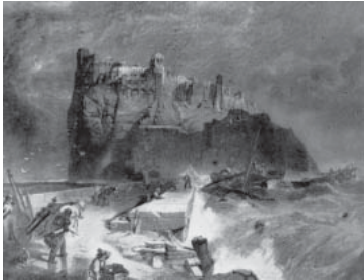
Il Castello durante le guerre napoleoniche (foto Lembo da una stampa inglese del tempo, in Gina Algranati, Ischia , op. cit.)

de intus castro nostro gironis, una cum omnes peculias et mobillas seu horganeas..." (... e parimenti offriamo l'intera nostra casa esistente sul nostro castro gironis con tutti i beni, mobili, giare...).