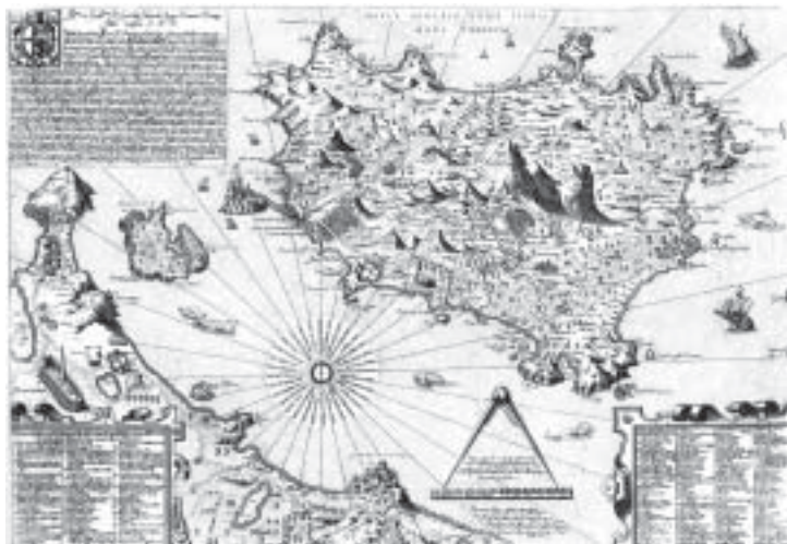
Mario Cartaro, Carta dell'isola d'Ischia , 1586, allegata alla prima edizione (1588) del De rimedi naturali di Giulio Iasolino

caso di locus terribilis incendii saxorum vulgo le cremate, attribuito alla colata dell'Arso. La parola vulgo introduce anche altrove il nome locale. I centri abitati sono preceduti da pagus , vicus , e solo Ischia è civitas 4 .