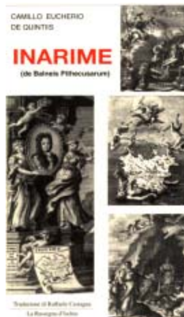
Frontespizio di Inarime o i Bagni di Pitecusa di Camillo Eucherio de Quintis nella traduzione dal latino da Raffaele Castagna, 2003.

Il De Rimedi di Iasolino è il «primo libro che tratti solo dell'isola d'Ischia: non solo ne descrive i rimedi, valorizzando il ricco patrimonio balneologico, ma ne delinea anche una sintesi di carattere storico e ne fa una prima descrizione geografica a cui tutti continuarono ad attingere per almeno due secoli dopo di esso» 4 .