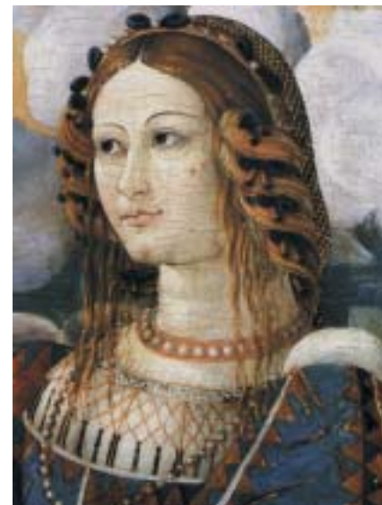
Vittoria Colonna - Particolare della Madonna delle Grazie e committenti (Ischia, Chiesa di Sant'Antonio)

infiammava d'ardore per la guerra, la seconda si sentiva maggiormente attratta dalla dolcezza delle muse, se Sannazaro, Cariteo, Rota, Bernardo Tasso, declamavano i loro versi, o se Musofilo, Filocalo, Giovio (7), Minturno discutevano della cultura umanistica. (...) In questa schiera d'élite, sebbene la duchessa di Francavilla occupasse il primo posto e Vittoria Colonna vi brillasse più di tutte, vi si trovavano in gran numero altre nobili dame di Sicilia e di Napoli che per la loro intelligenza ben ne facevano parte. Il nome d'Ischia era allora famoso dappertutto, come punto d'incontro di tanta grazia e di tanta gloria» 8 .