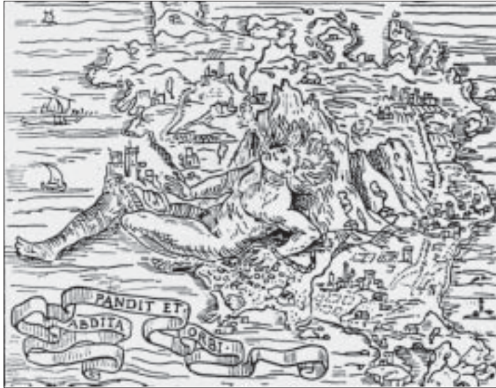
Frontespizio della prima edizione del De' rimedi naturali di Giulio Iasolino, Napoli 1588.