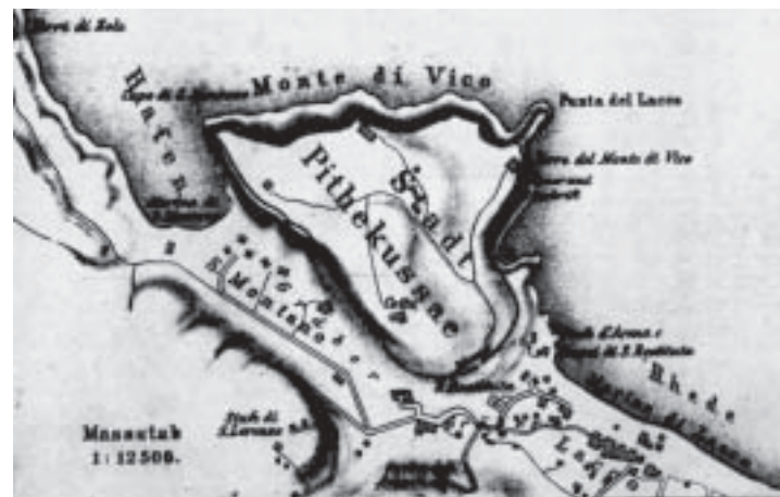
Cartina dell'antica città di Pithekussae contenuta in Campanien. Geschichte und Topographie des antiken Neapel und seiner Umgebung di Karl Julius Beloch, 1890.

Si parla talor del «ciclope Achemòne che col fratello Bàsala viveva di brigantaggio nell'isola di Pitecusa. Un giorno i due furfanti ebbero la pessima idea di assaltare Eracle mentre dormiva; ma l'eroe li legò per i piedi e li appese all'estremità della clava, caricandoseli sulla spalla a testa in giù; divertito poi per una loro osservazione alquanto spiritosa li perdonò e li lasciò liberi» 2 . Continuando però nelle loro ribalderie, i due fratelli tentarono di ingannare lo stesso Zeus, che li mutò in scimmie (πίθηκοι) e li confinò nelle isole di Procida e di Inarime , e così Pitecuse furono chiamate le isole da loro abitate 3 .