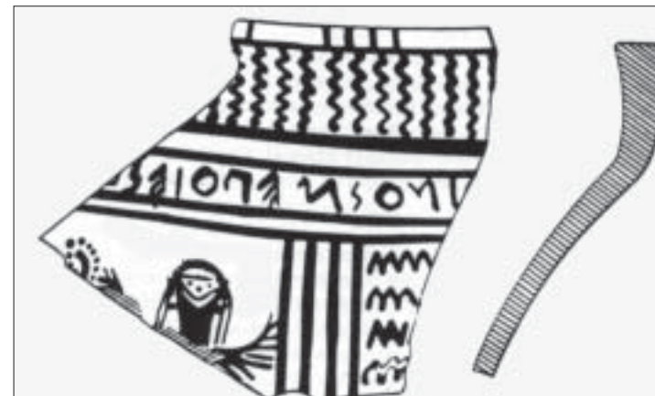
Frammento dell'orlo di un cratere LG locale con iscrizione dipinta, retrograda: ... inos m'epois(e) = ... ino mi fece (in D. Ridgway - L'alba della Magna Grecia , Longanesi 1984). Il Peruzzi pose l'attenzione sulla figura in basso, considerata una scimmia.

Circa l'etimologia di Pitecusa, derivata ora a simiarum multitudine (la presenza delle scimmie), ora a figlinis doliorum (le fabbriche di anfore), «c'è una terza possibi-