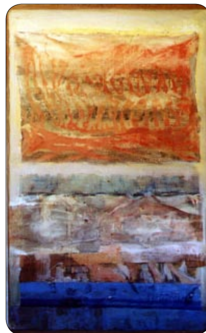
W. Sertürner - Streifen 1962

I principi e i significati dell'orizzontale e del verticale - sul modello di Mondrian - vengono sempre di più recepiti - spesso come struttura di linee appena riconoscibili, ma pensate, che sono di sostegno alla creazione di un quadro ed anche all'osservatore. Viene ripreso anche il significato dell'angolo retto come limite della superficie (cfr. Gropius), sempre sfuggono due parti di un piano per rendere così possibile il reciproco solco sulla superficie. I lavori risalenti agli anni '60 sono caratterizzati da forme naturali. Forme naturali scaturite dalla casualità, dall'osservazione e dal controllo del movimento del colore cioè del materiale cromatico o dalla sperimentazione con mezzi e strumenti diversi di arricchimento del colore come anche della sua sottrazione o eliminazione.