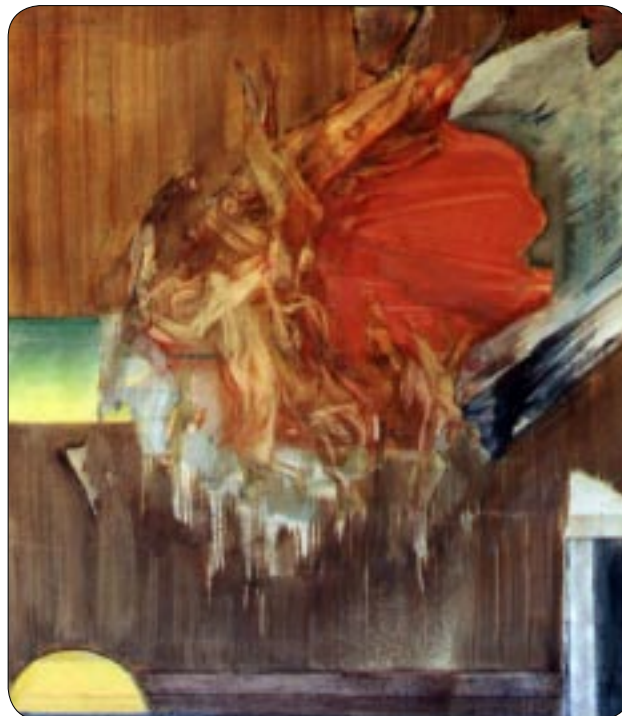
W. Sertürner: Apokalypse, 1979

tung des rechten Winkels als Flächenbegrenzung (vgl. Gropius) wird aufgenommen - immer wieder entfallen zwei Seiten einer Fläche, um so das gegenseitige Furchdringen zu ermöglichen. Von naturalen Formen sind die Arbeiten aus den 60-iger Jahren bestimmt. Naturale Formen aus Zufälligem entstanden - aus der Beoba-