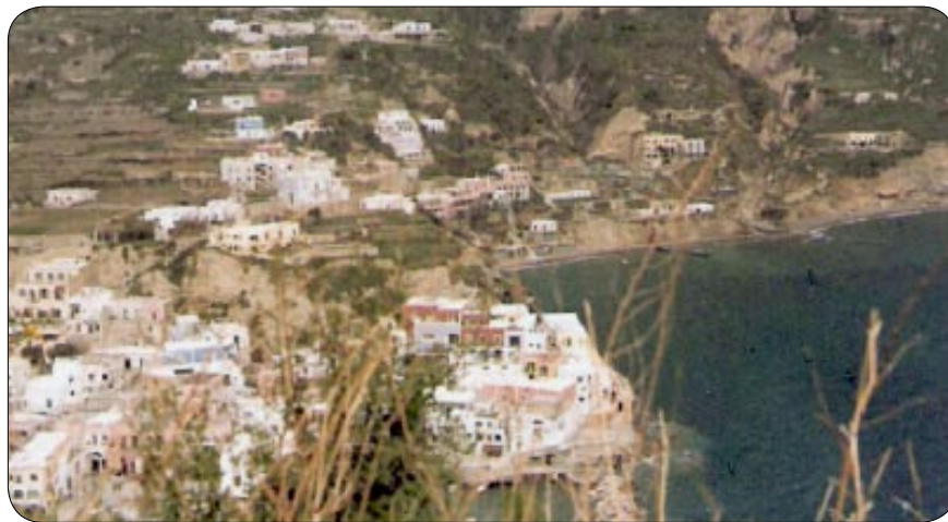
Sant'Angelo 1964

Seguono d'estate altri soggiorni a Ischia, d'inverno vive in Germania, di solito ad Hameln. Lei è membro dell' "Arche", ora anche come componente di giuria e partecipa regolarmente a mostre collettive.