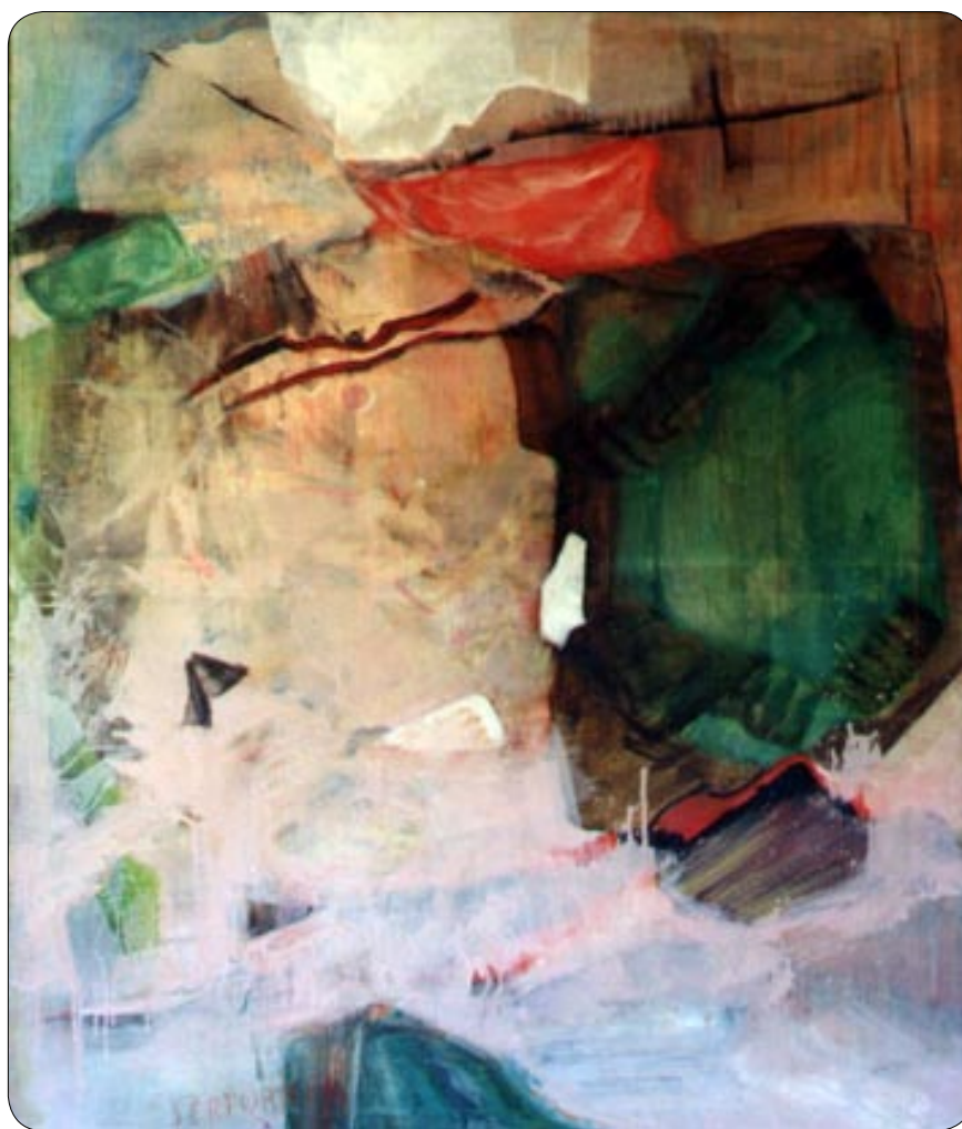
W. Sertürmer: ERA 1992

Und dann – das Einfügen / das Einführen des Menschen bzw. der bildnerischen Form für "Mensch". Jedes Mal ist dieses Einbeziehen ein Problem. Aber Wernhera Sertürmer kann und will darauf nicht verzichten.