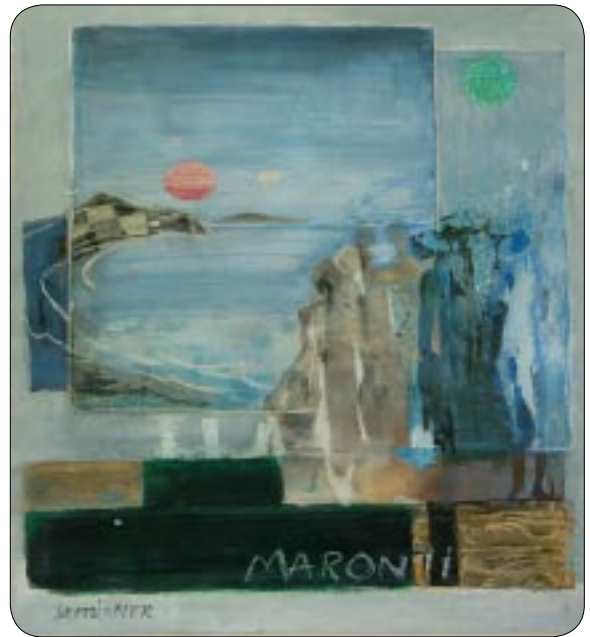
W. Sertürner - Maronti / Ischia (1970)